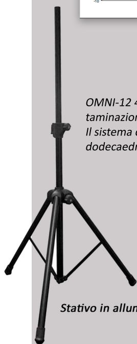
Stativo in alluminio (optional)

Il sistema di sostegno inferiore è dotato di una piccola base che ha anche la funzione sostenere il dodecaedro sul pavimento evitando la sua accidentale rotazione e/o capovolgimento .