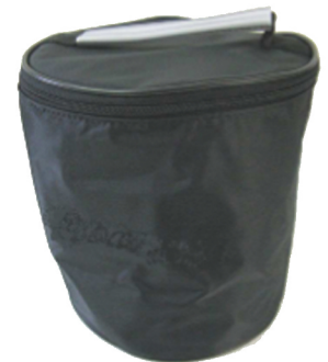
Borsa imbottita in dotazione