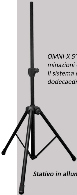
Stativo in alluminio (optional)

Il sistema di sostegno inferiore è dotato di una piccola base che ha anche la funzione sostenere il dodecaedro sul pavimento evitando la sua accidentale rotazione e/o capovolgimento.